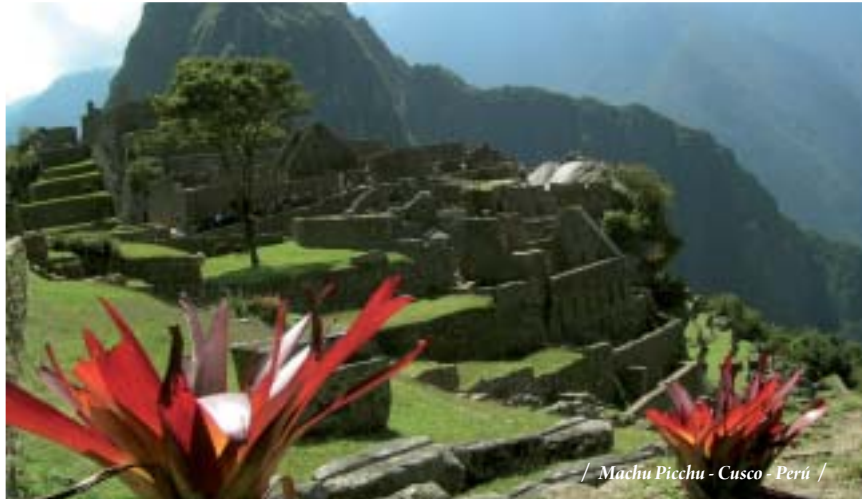
/ Machu Picchu - Cusco - Perú /

23 DIAS - 21 NOCHES / Lima - Chiclayo - Trujillo - Ica , Nasca - Arequipa - Colca - Puno - Cusco - Machu Picchu - Puerto Maldonado