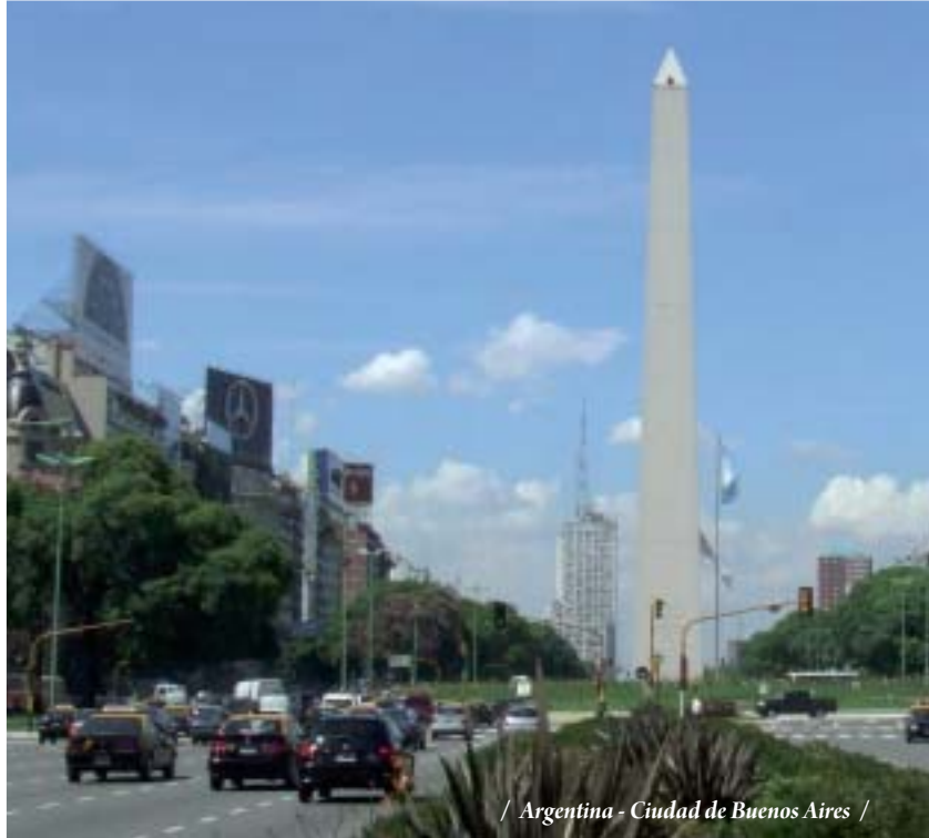
/ Argentina - Ciudad de Buenos Aires /

15 DIAS - 13 NOCHES Ciudad de Buenos Aires - Iguazú - Ushuaia - El Calafate