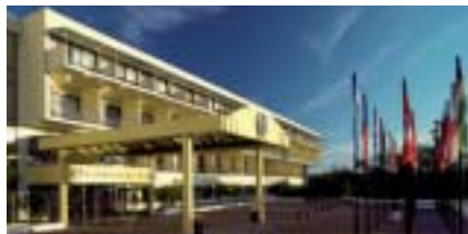
Hotel Sheraton Iguazú Resort & Spa