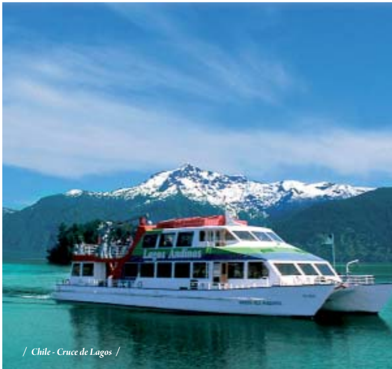
/ Chile - Cruce de Lagos /

18 DIAS - 16 NOCHES Santiago de Chile - Puerto Varas - Cruce de Lagos - Bariloche - El Calafate - Ushuaia - Ciudad de Buenos Aires