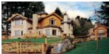
Villa Huinid Hotel Resort & Spa