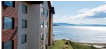
Xelena Deluxe Suites Hotel