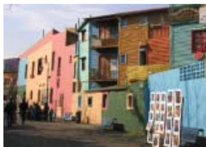
Fin de servicios

Argentina lo despedirá confiada en que ha recorrido una de las regiones más hermosas del planeta. El Aeropuerto Internacional de Ezeiza será su última escala antes de abordar su vuelo de regreso.