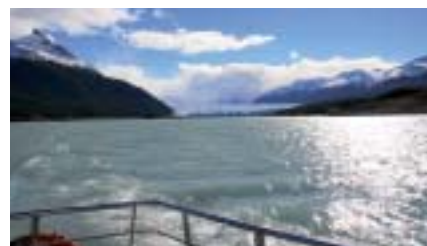
Fin de servicios

Esta ciudad, con el encanto especial que le dan las dos vistas típicas de la zona, la estepa de un lado y el Lago Argentino del otro, lo despedirá, segura de que se llevará uno de los mejores recuerdos de la Patagonia.