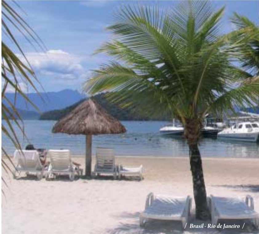
/ Brasil - Río de Janeiro /