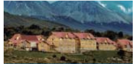
Hotel Cauquenes Resort & Spa.