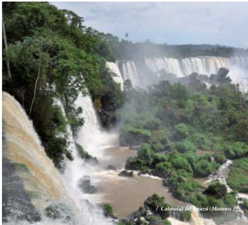
/ Cataratas del Iguazú - Misiones /

15 DIAS - 13 NOCHES Ciudad de Buenos Aires - Iguazú - Puerto Madryn - El Calafate