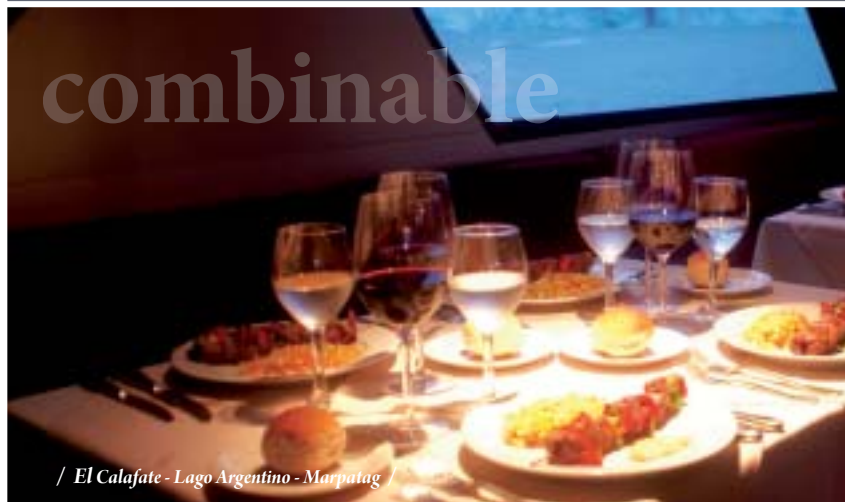
/ El Calafate - Lago Argentino - Marpatag

04 DIAS - 03 NOCHES El Calafate - Lago Argentino