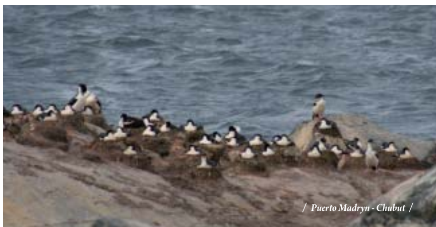
/ Puerto Madryn - Chubut /

Puerto Madryn, aventura en la península: Este día se destinará a disfrutar de la fauna marina en la Península de Valdés: elefantes marinos, pingüinos en Caleta Valdés y gran variedad de aves. Desde Puerto Pirámides zarpará hacia las