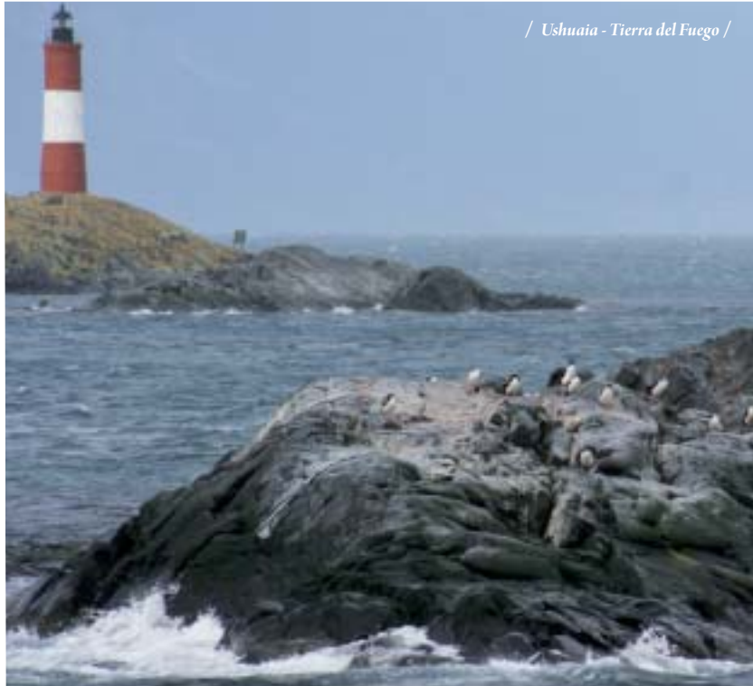
/ Ushuaia - Tierra del Fuego /