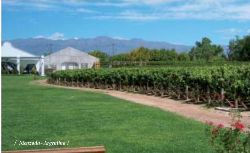
/ Mendoza - Argentina /

04 DIAS - 03 NOCHES / Mendoza - Vitivinícola zona Centro y del Valle de Uco