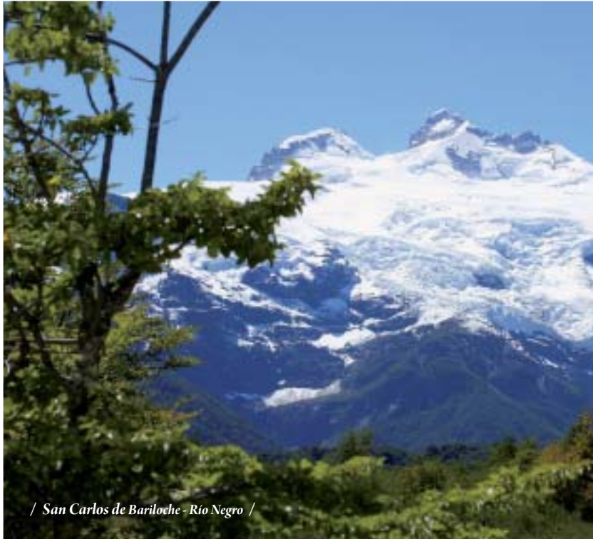
/ San Carlos de Bariloche - Río Negro /

18 DIAS - 16 NOCHES Ciudad de Buenos Aires - Iguazú - Puerto Madryn - El Calafate - Bariloche