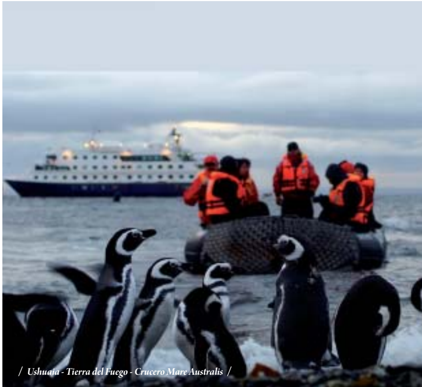
/ Ushuaia - Tierra del Fuego - Crucero Mare Australis /

18 DIAS - 16 NOCHES Ciudad de Buenos Aires - Iguazú - El Calafate - Ushuaia - Crucero Mare Australis