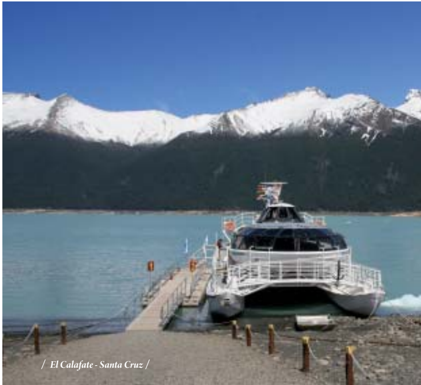
/ El Calafate - Santa Cruz /