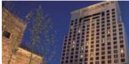
Intercontinental Hotels & Resorts