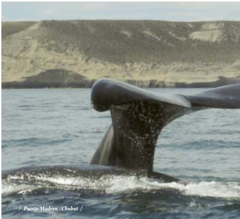
/ Puerto Madryn - Chubut /