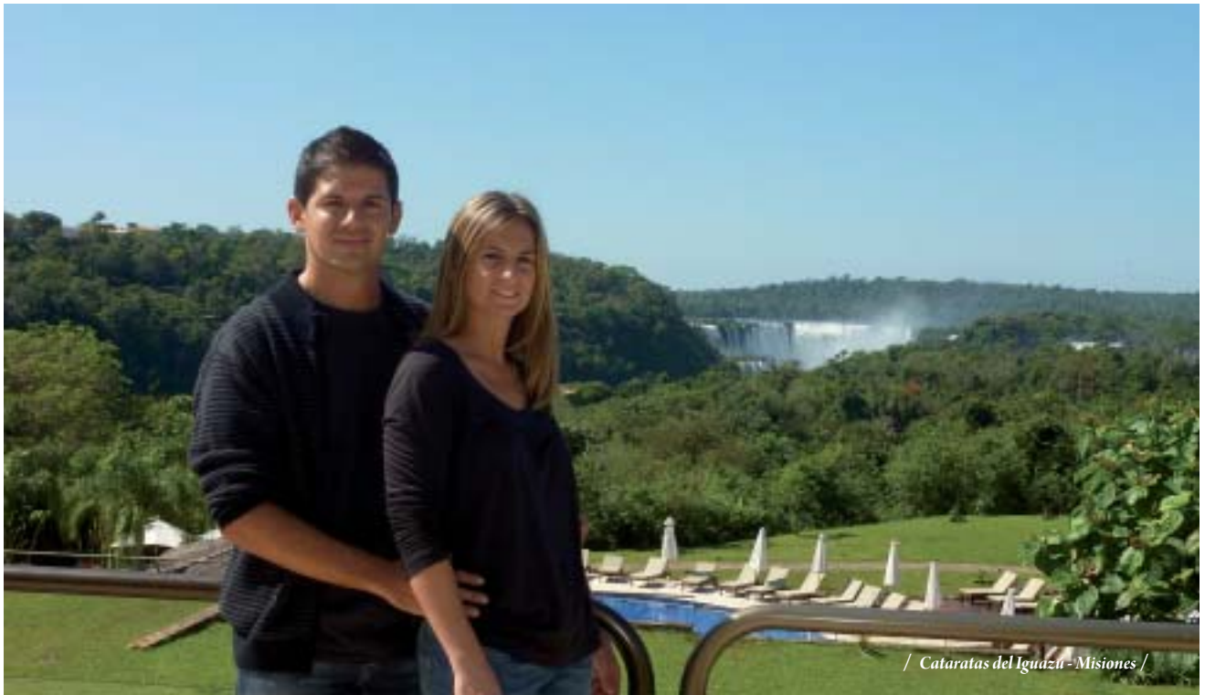
/ Cataratas del Iguazú - Misiones /